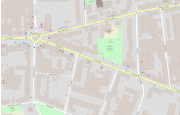
✖ TCL C3, arrêt « Institut d'Art Contemporain »